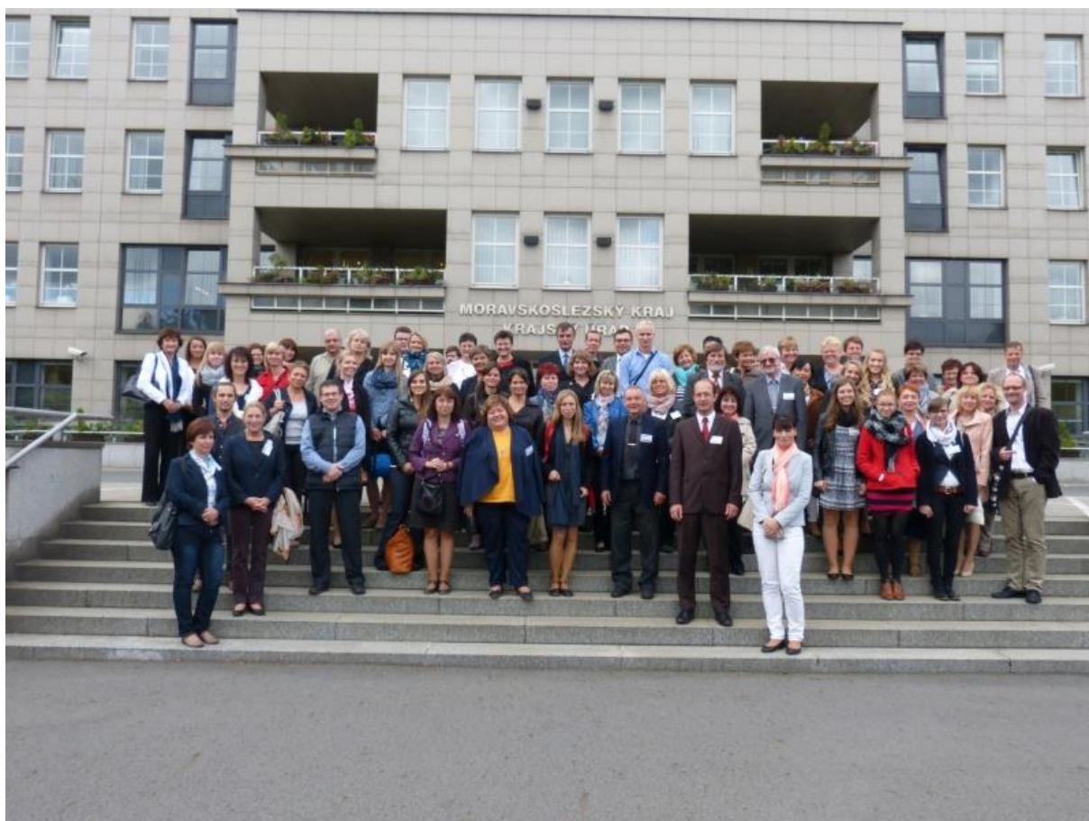
Účastníci zasedání sítě škol ASPnet UNESCO na přednášce v Ostravě.

Setkání Asociace škol přidružených UNESCO v České republice letos zorganizovalo Gymnázium Olgy Havlové v Ostravě ve spolupráci s Ministerstvem zahraničí ČR a Českou komisí pro UNESCO . Akce, která se konala v reprezentativních prostorách Krajského úřadu MSK a Domu kultury města Ostravy, se zúčastnili čestní hosté a zástupci více než 50 škol z celé České republiky. Setkání se odehrálo s podporou Moravskoslezského kraje a pod záštitou náměstkyně hejtmana Mgr. Věry Palkové ve dnech 21. – 22. září 2015 . Tematicky bylo v letošním roce zaměřeno na problematiku lidských práv , která je v rámci projektů UNESCO prioritní osou.