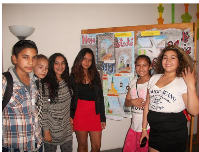
Soutěž Naše město