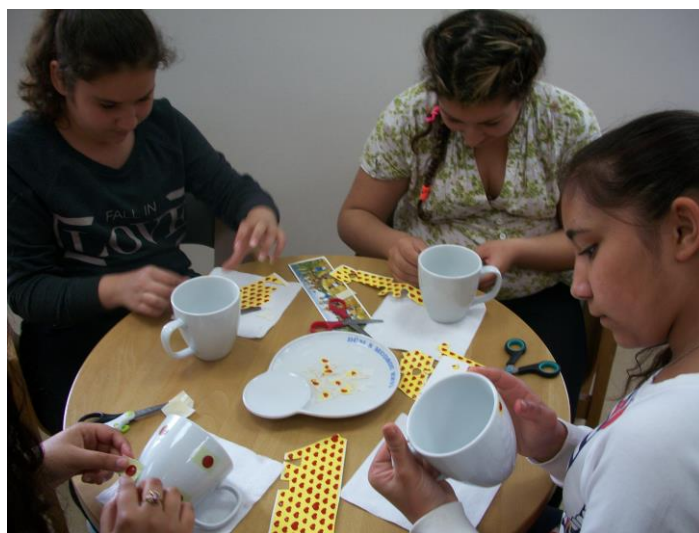
Porcelánka v Dubí