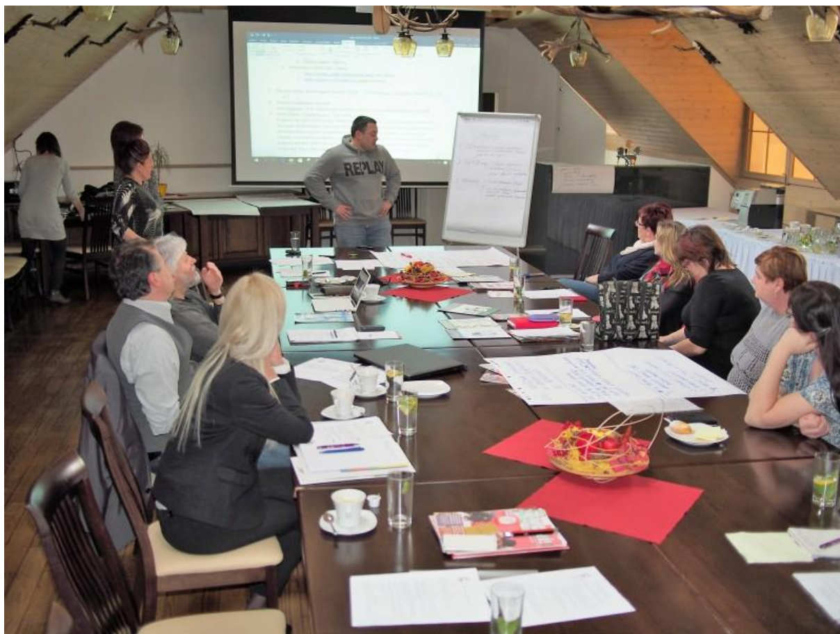
Členská schůze Ligy komunitních škol v Černé Hoře

Poděkování za podporu jednání patří nadaci Open Society Fund Praha, dále všem členům Ligy komunitních škol za práci ve spolku a v neposlední řadě i inkluzivní práci ve školách.