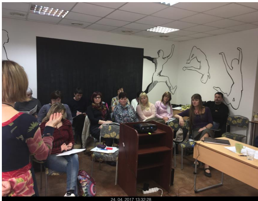
Setkání Ligy komunitních škol