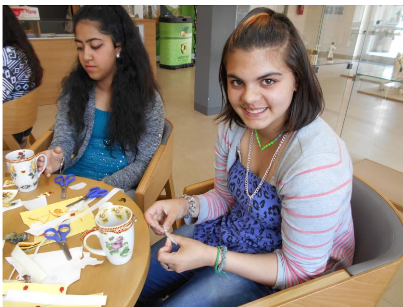
Porcelánka v Dubí